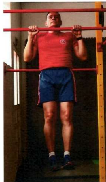
Imagem 2 – Flexão de Braços na Barra – Execução